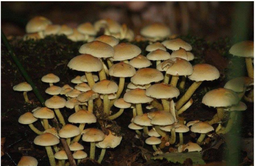
Dorien Wandel, Schuddebeurs 2015