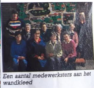
Een aantal medewerkers aan het wandkleed